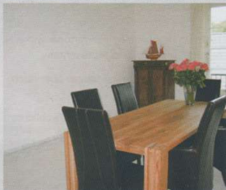
Vorher und nachher: Das Esszimmer wirkte kahl, steril und die meiste Zeit des Tages zu dunkel (links). Die hellen Bilder verbessern das Ambiente und verstärken das Tageslicht im Raum (rechts).